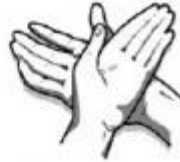
2. Dešinėsios rankos delnu trinamas kairiosios plaštakos viršus.