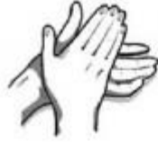
1. Delnas trinamas į delną.