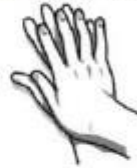
4. Suglaudžiami delnai, supinami pirštai ir trinami.