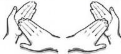
7. Sukamais judesiais trinamas kiekvienos rankos delnas.