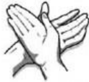
3. Kairiosios rankos delnu trinamas dešinėsios plaštakos viršus.